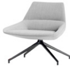
Low backrest with swivel base Respaldo bajo con base piramidal giratoria Dossier bas avec pietement giratoire