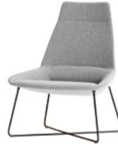
High backrest with rod base Respaldo alto con base varilla Dossier haut avec pietement en tige d'acier