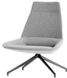
High backrest with swivel base Respaldo alto con base piramidal giratoria Dossier haut avec pietement giratoire