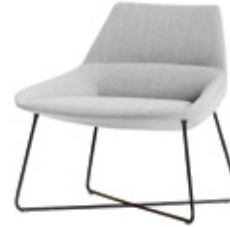
Low backrest with rod base Respaldo bajo con base varilla Dossier bas avec pietement en tige d'acier